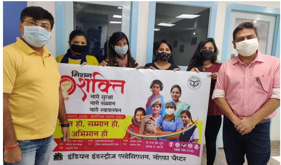
नोएडा (गौतम बुद्ध नगर) चैप्टर 19 अक्टूबर 2020