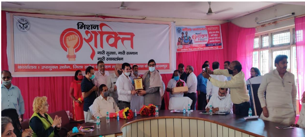
सहारनपुर चैप्टर 23 अक्टूबर 2020