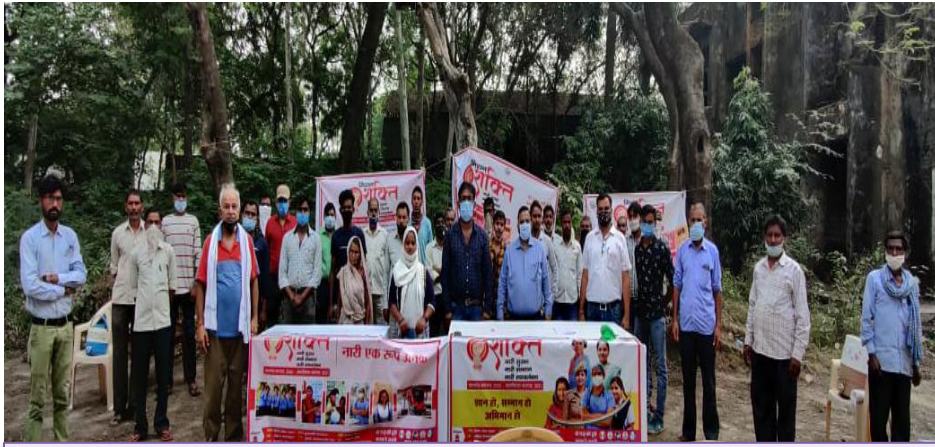
रायबरेली चैप्टर 18 अक्टूबर 2020