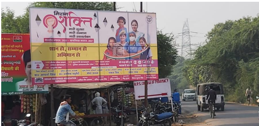
बाराबंकी चैप्टर 21 अक्टूबर 2020