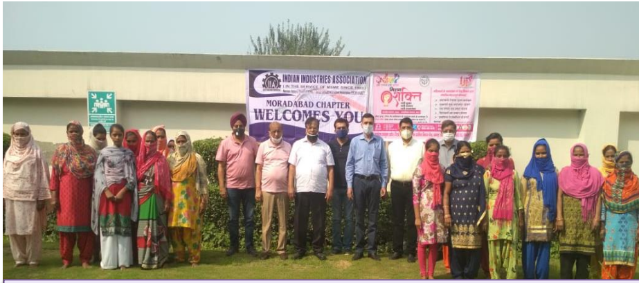
मुरादाबाद चैप्टर 22 अक्टूबर 2020