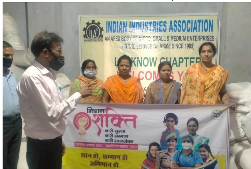
लखनऊ चैप्टर 18 अक्टूबर 2020