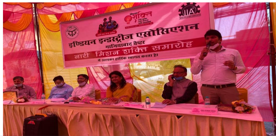
गाजियाबाद चैप्टर 23 अक्टूबर 2020