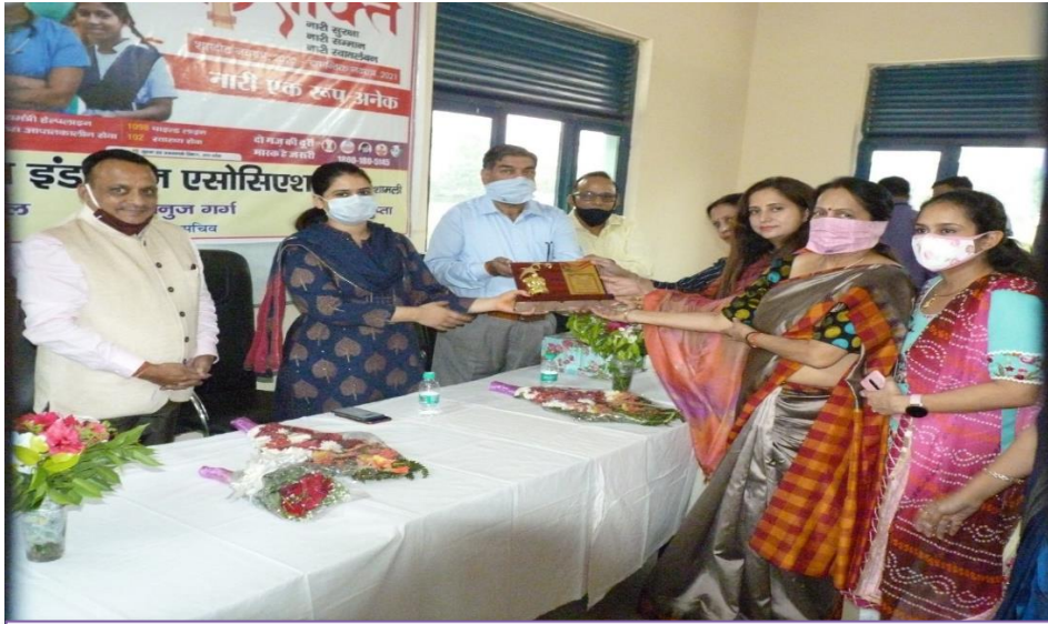
शामली चैप्टर 24 अक्टूबर 2020